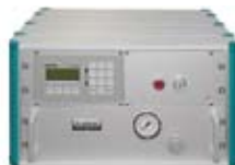
Durchflussprüfgerät LTS 673

optimiert zur Prüfung von großvolumigen Bauteilen mit Hilfe einer Durchflussmessung