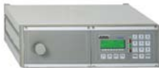
Lecktestsystem LTS 670

bewährtes Lecktestsystem für Differenzdruckprüfungen oder Relativdruckprüfungen