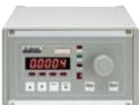
Lecktestgerät LTS compact

kostengünstiges Einzweck-Dichtheitsprüfgerät nach dem Relativdruckverfahren