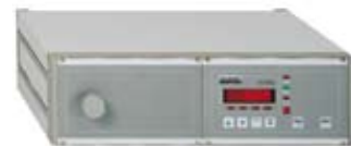
Lecktestsystem LTS 670L

kostengünstiges Einzweck-Dichtheitsprüfgerät für die Differenzdruckprüfung oder Durchflussmessung