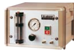
Einperlgerät Typ 6.3

pneumatisch gesteuertes Dichtheitsprüfgerät nach dem Einperlverfahren für Werkstatt und Produktion